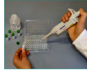
3. HybriScan®-Testlösung (Binden der Probe an spezifische Sonden, 10 min)