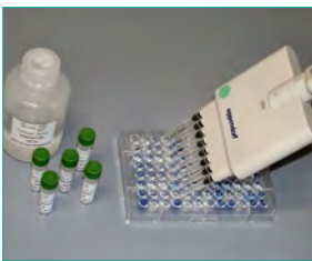
7. Nachweisreaktion (Farbreaktion und Abstoppen, 10 min)