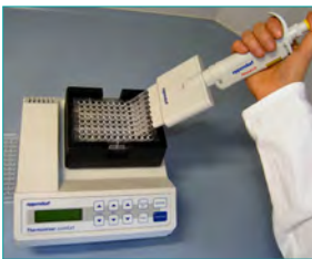
4. Immobilisierung (Binden des „Sandwichs“ an Bindeplatte, 10 min)