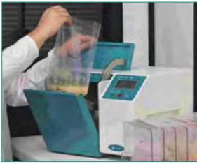
1. Probenvorbereitung & Anreicherung