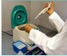
2. Zellyse (2 ml Probe, 13.000 rpm; 37°C, 45-60 min)