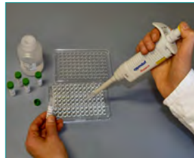
5. Enzymreaktion (Kopplung des Enzyms an die Komplexe, 10 min)