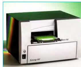
8. Messsignal fotometrisch auslesen