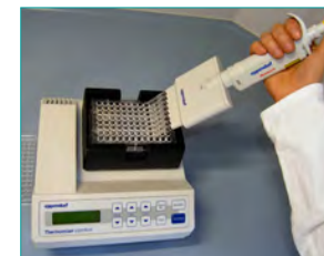
6. Waschen (Entfernen ungebundener Komponenten, 2x 1min)