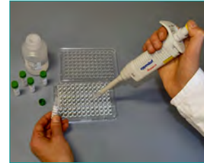
3. Hybridisierung & Immobilisierung (Bindung spezifischer Sonden an die Probe im Zell-Lysat, 15 min)