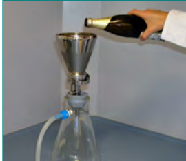
1. Probenaufschluss & Anreicherung, (optional Plattieren)