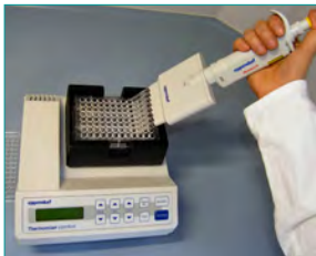
4. Waschen (Entfernen ungebundener Komponenten, 2 min)