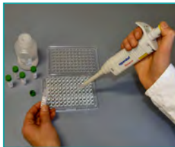
4. HybriScanScan®-Testlösung (Binden der Probe an spezifische Sonden, 10 min)