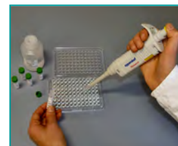
6. Enzymreaktion (Kopplung des Enzyms an das „Sandwich“, 10 min)