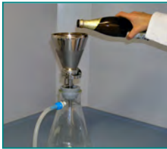
1. Probe filtrieren (100 – 1000 ml, 15 min)