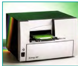
8. Meßsignal auslesen (Farbreaktion und Signal- auslesung, 15 min)