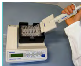
4. Waschen (Entfernen ungebundener Komponenten, 2 min)