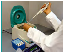
2. Zell-Lyse (2 ml Probe oder Bakterienkolonie)