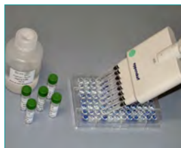
7. Farbreaktion (Farbreaktion und Abstoppen, 2-15 min)