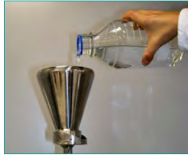
1. Probenaufschluss & Anreicherung, (optional Plattieren)