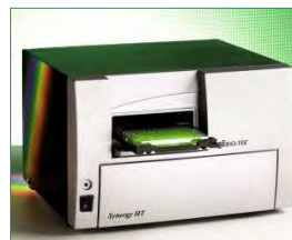
8. Messsignal fotometrisch auslesen