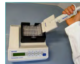
6. Waschen (Entfernen ungebundener Komponenten, 2x 1min)