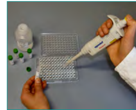
3. Hybridisierung & Immobilisierung (Bindung spezifischer Sonden an die Probe im Zell-Lysat, 15 min)