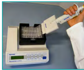
5. Immobilisierung (Binden des „Sandwichs“ an Affinitätsplatte, 10 min)