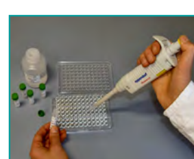
6. Enzymreaktion (Kopplung des Enzyms an das „Sandwich“, 10 min)