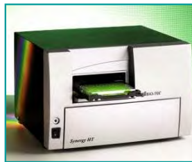
8. Meßsignal auslesen