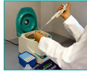
3. Zell-Lyse (2 ml Probe, 13.000 rpm; 37°C, 45 min)