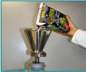
1. Probe filtrieren (250 – 1000 ml AfG, 15 min)