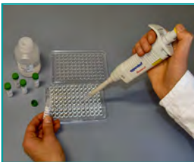
4. HybriScan®-Testlösung (Binden der Probe an spezifische Sonden, 10 min)