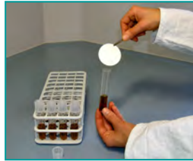
2. Filter inkubieren (z.B. MRS-Broth, 24h)